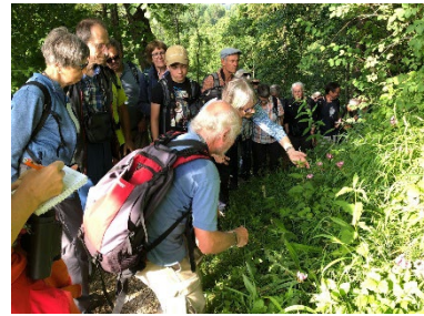
Botanische Exkursion im Alpstein