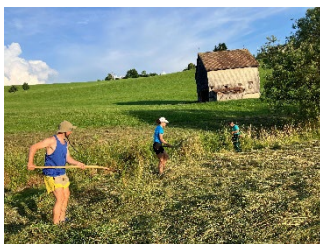
Heuen bei der Hecke im Bommies