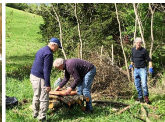
Bau einer Wieselburg